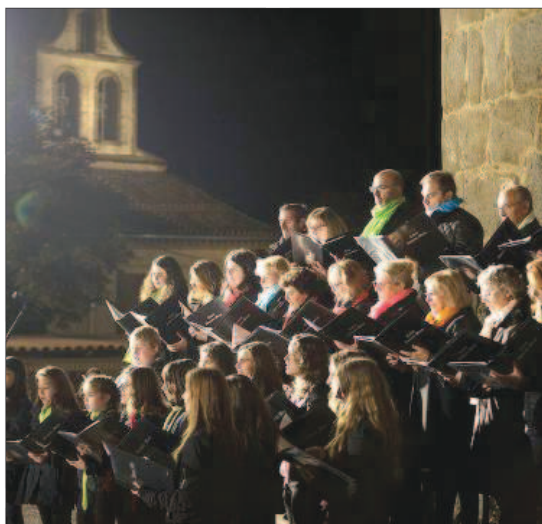
Integrantes de la coral y de la escolanía durante la ofrenda a Santa Teresa.

nea, desde el Renacimiento hasta nuestros días. Esta coral organiza y participa en las Jornadas Polifónicas Internacionales Ciudad de Ávila, que han adquirido gran prestigio y renombre por el alto nivel de los coros participantes y que ha conseguido, con mucho esfuerzo, mantener año tras año su carácter internacional de este certamen coral, que el año que viene llegará a su vigésima edición. El año pasado fueron invitados a estas Jornadas Polifónicas el coro alemán Voices 'Chor Au Würzburg', un grupo formado por 55 coralistas, que permanecieron en Ávila durante cinco días, descubriendo esta ciudad. Para el próximo año la coral tiene previsto —si consigue los fondos necesarios— desplazarse a Alemania, invitados por el grupo alemán, devolviendo de este modo la visita del grupo alemán. La