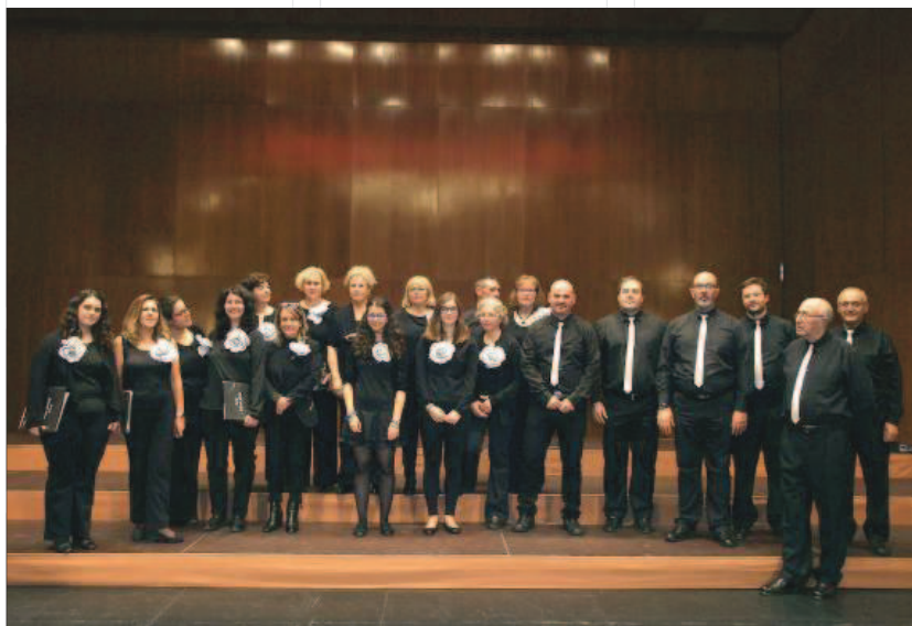
La coral, durante el último concierto que ofrecieron en Manzanares.